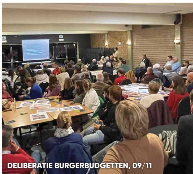
DELIBERATIE BURGERBUDGETTEN, 09/11