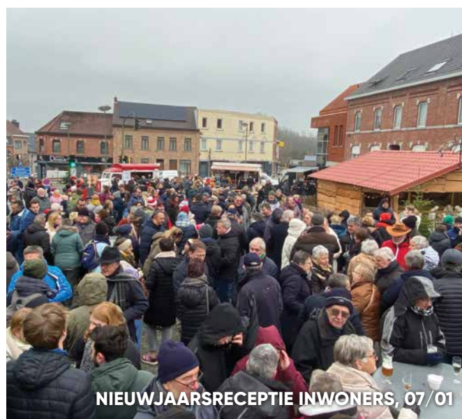
NIEUWJAARSRECEPTIE INWONERS, 07/01