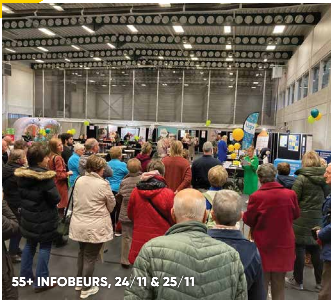
55+ INFOBEURS, 24/11 & 25/11