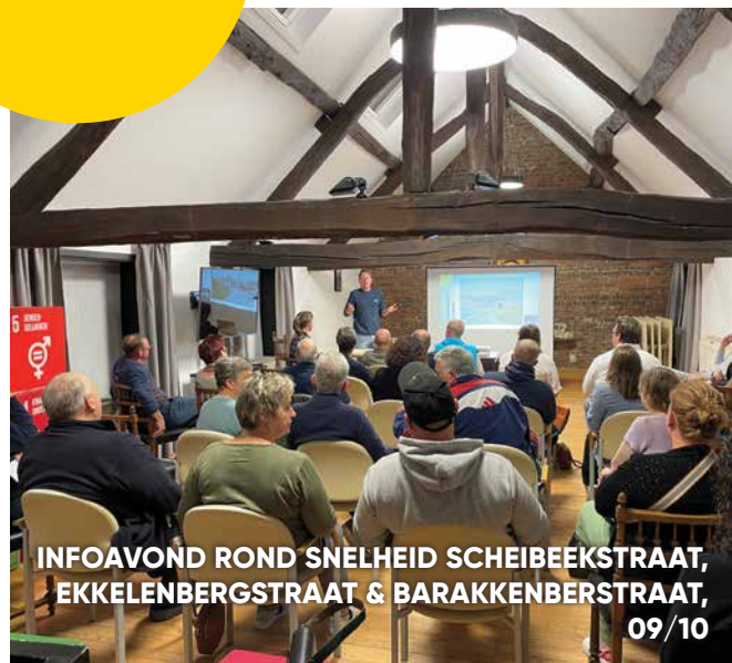
INFOAVOND ROND SNELHEID SCHEIBEKSTRAAT, EKKELENBERGSTRAAT & BARAKKENBERSTRAAT, 09/10