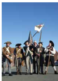
tijdens de herdenking 225 jaar boerenkrijg op 15 oktober 2023.

Door een foto in te sturen, maak je als inwoner kans om de gemeentelijke wedstrijd 'digitale fotografie' te winnen.