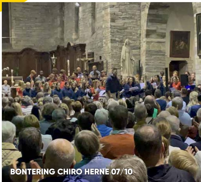
BONTERING CHIRO HERNE 07/10