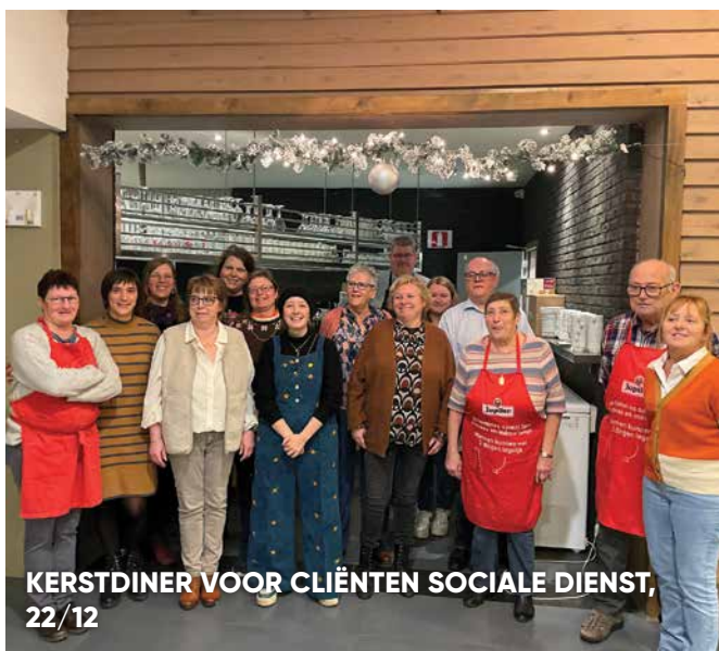
KERSTDINER VOOR CLIËNTEN SOCIALE DIENST, 22/12