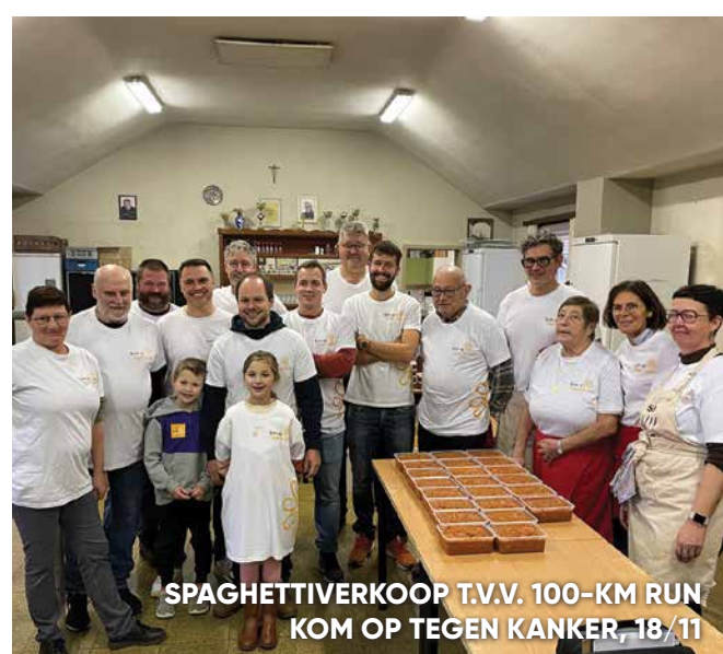
SPAGHETTIVERKOOP T.V.V. 100-KM RUN, KOM OP TEGEN KANKER, 18/11