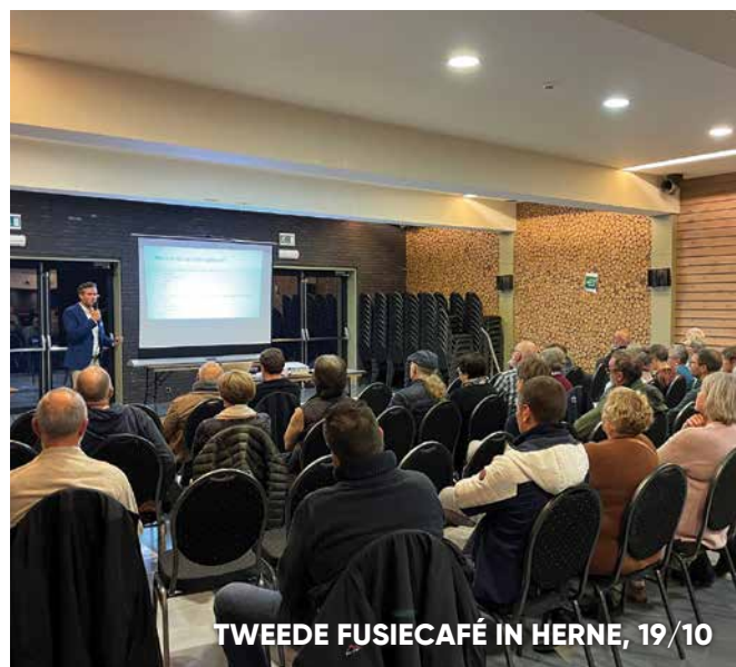
TWEDE FUSIECAFÉ IN HERNE, 19/10