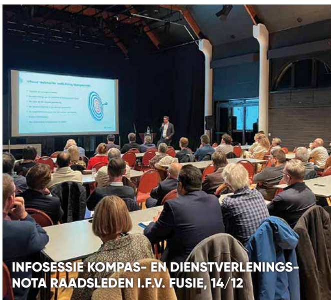
INFOESSIE KOMPAS- EN DIENSTVERLENINGS-NOTA RAADSLEDEN I.F.V. FUSIE, 14/12