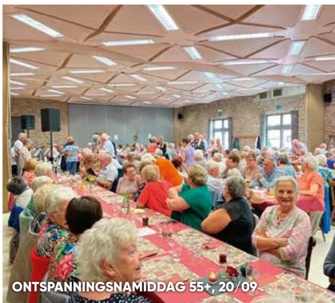
ONTSPANNINGSNAMIDDAG 55+, 20/09