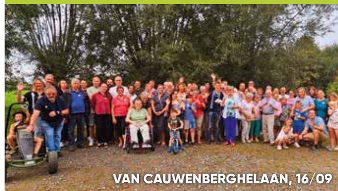
VAN CAUWENBERGHELAAN, 16/09