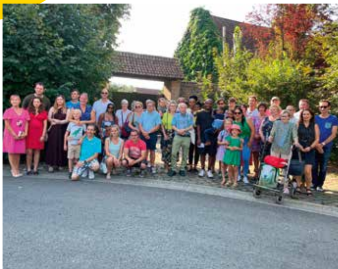
VERWELKOMING NIEUWE INWONERS, 10/09