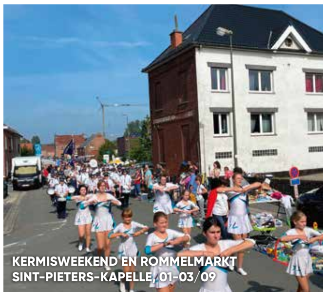
KERMISWEEKEND EN ROMMELMARKT SINT-PIETERS-KAPELLE, 01-03/09