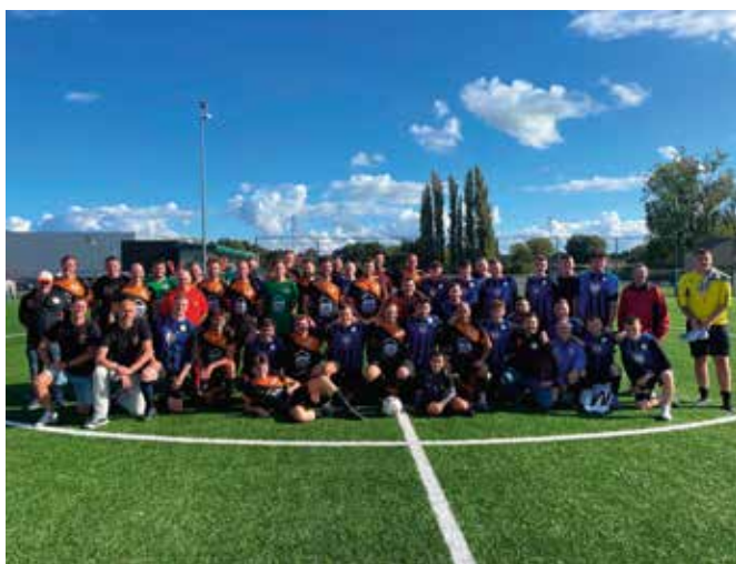
KVKB BOUWVRIENDEN 50 JAAR, 23/09