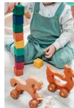
Cottonbro Studio - Pexels

Kinderen zijn onze toekomst, investeren in kinderopvang is dan ook investeren in de toekomst. Het lokaal bestuur erkent de crisis in de kinderopvang en voorziet in ondersteuning voor kinderopvanginitiatieven.