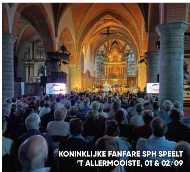
KONINKLIJKE FANFARE SPH SPEELT 'T ALLERMOOIESTE, 01 & 02/09