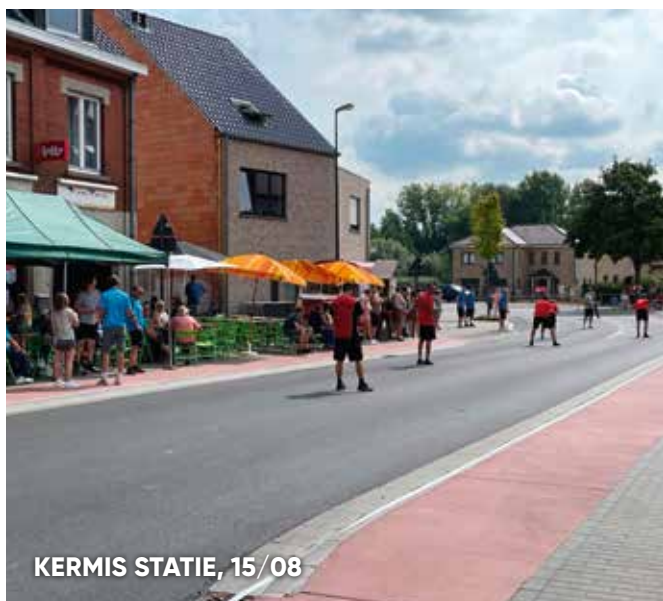
KERMIS STATIE, 15/08