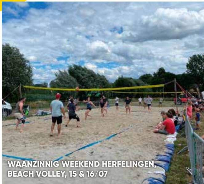
WAANZINNIG WEEKEND HERFELINGEN, BEACH VOLLEY, 15 & 16/07