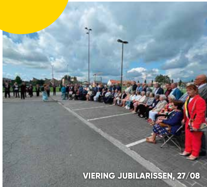
VIERING JUBILARISSEN, 27/08