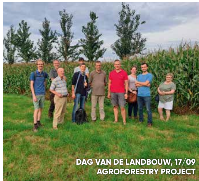
DAG VAN DE LANDBOUW, 17/09 AGROFORESTRY PROJECT