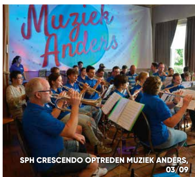
SPH CRESCENDO OPTREDEN MUZIEK ANDERS, 03/09