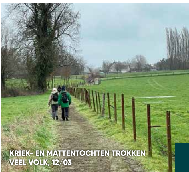
KRIEK- EN MATTENTOCHTEN TROKKEN VEEL VOLK, 12/03