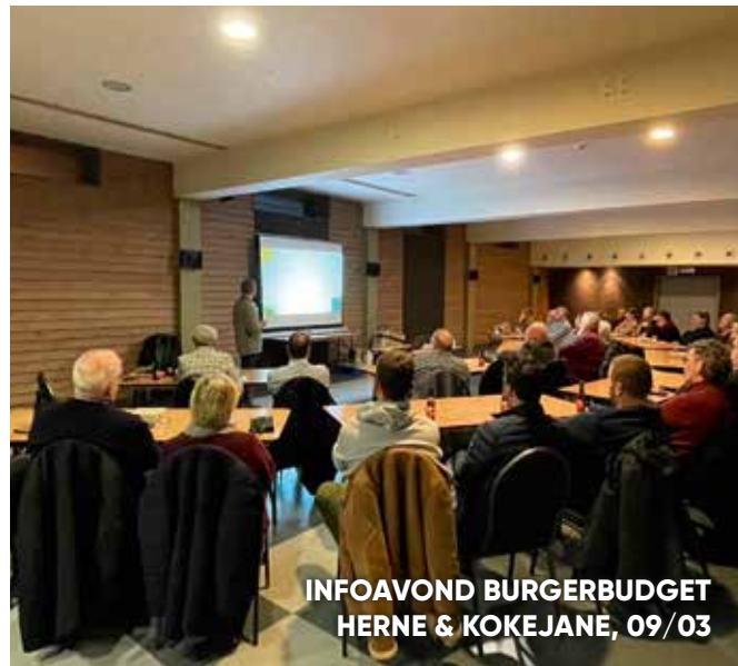
INFOAVOND BUDGET HERNE & KOKEJANE, 09/03