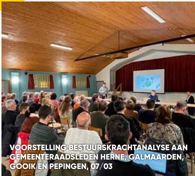
VOORSTELLING BESTUURSKRACHTANALYSE AAN GEMEENTERAADSLEDEN HERNE, GALMAARDEN, GOOIK EN PEPINGEN, 07/03