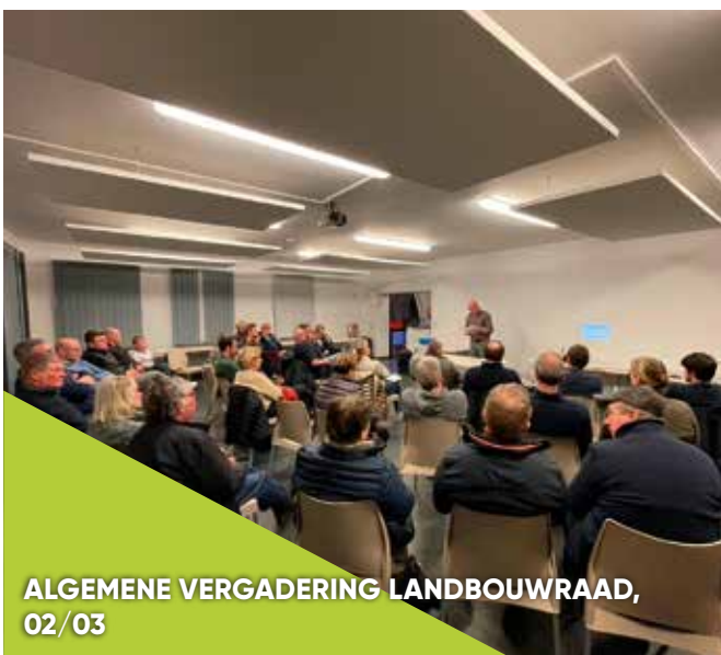
ALGEMENE VERGADERING LANDBOUWRAAD, 02/03