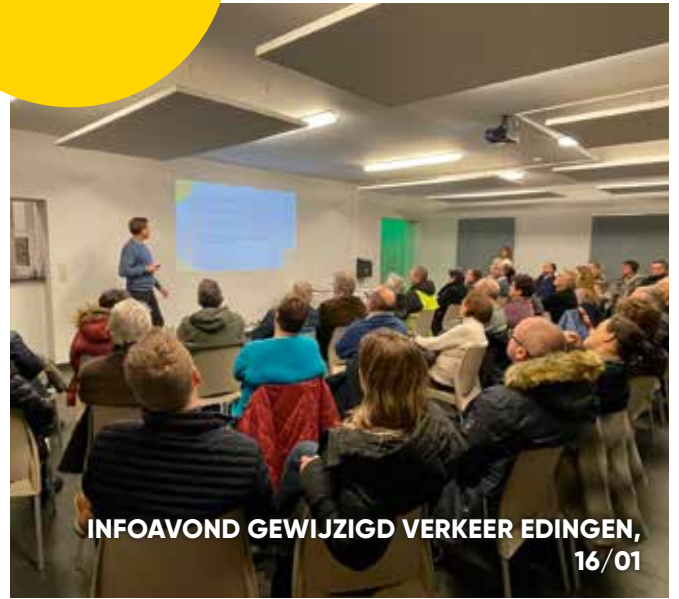
INFOAVOND GEWIJZIGD VERKEER EDINGEN, 16/01