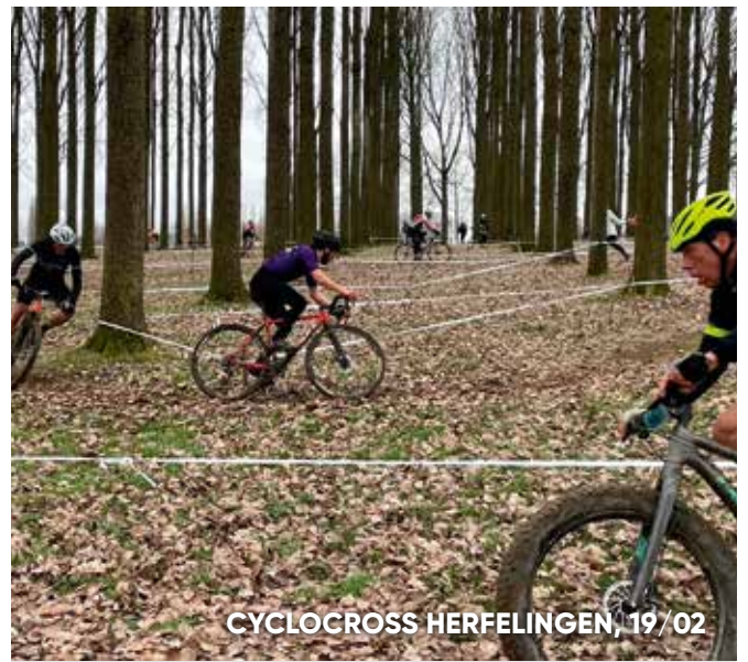
CYCLOCROSS HERFELINGEN, 19/02