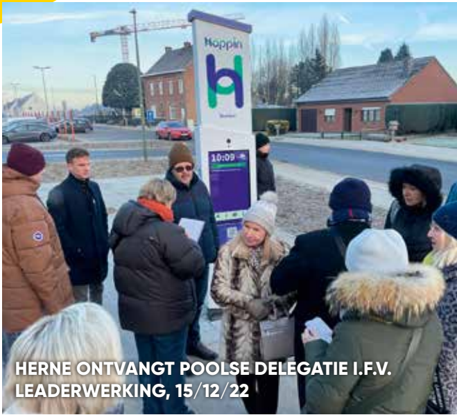
HERNE ONTVANGT POOLSE DELEGATIE I.F.V. LEADERWERKING, 15/12/22