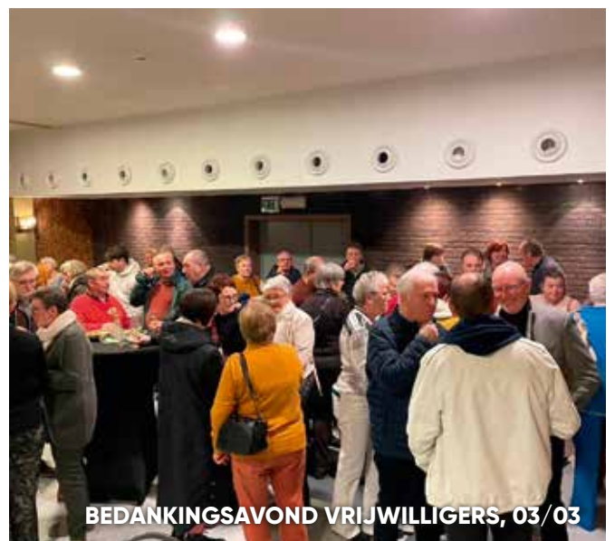
BEDANKINGSAVOND VRIJWILLIGERS, 03/03