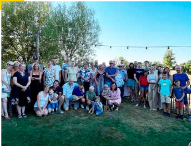
BUURTFEEST RASBEEKSTRAAT, 13/08