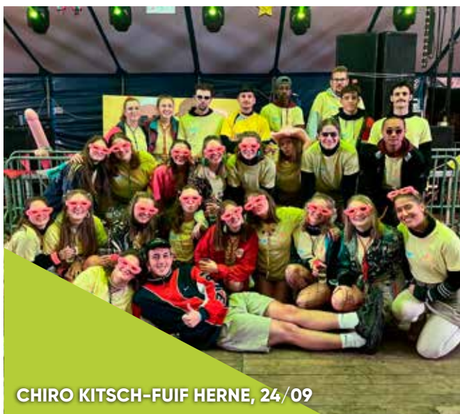
CHIRO KITSCH-FUIF HERNE, 24/09