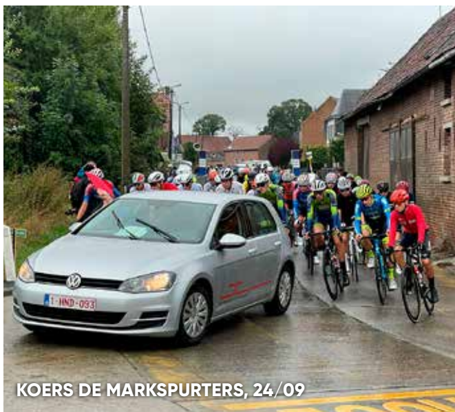
KOERS DE MARKSPURTERS, 24/09