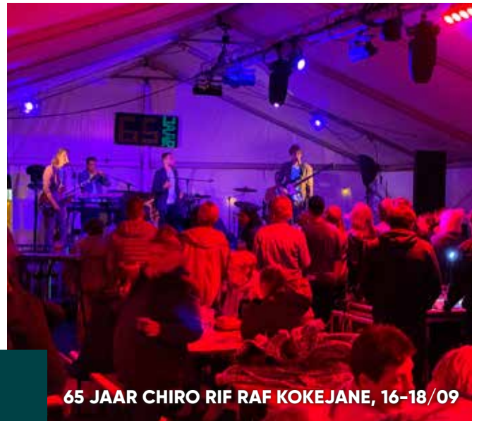
65 JAAR CHIRO RIF RAF KOKEJANE, 16-18/09