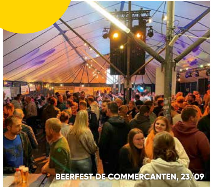
BEERFEST DE COMMERCANTEN, 23/09