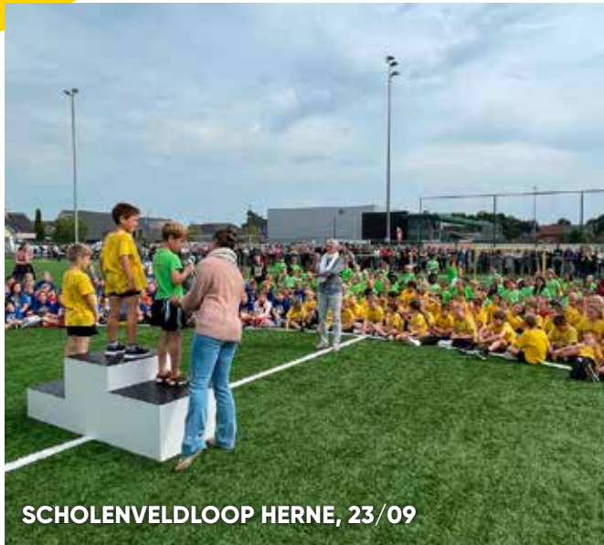
SCHOLENVELDLOOP HERNE, 23/09