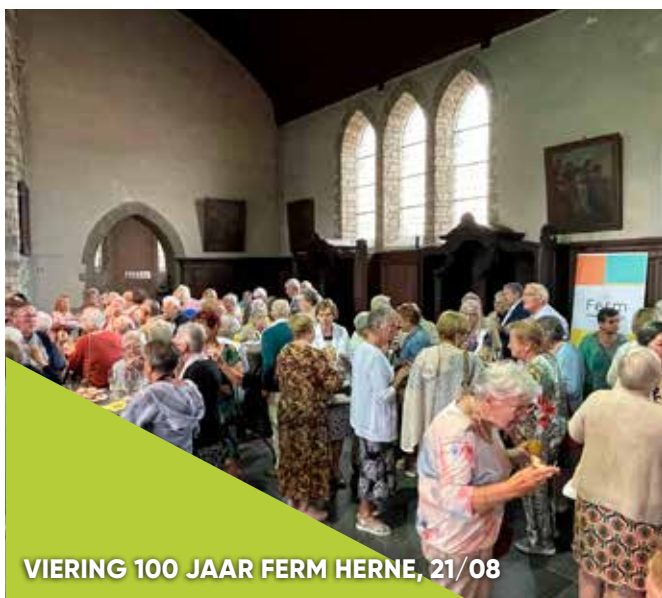
VIERING 100 JAAR FERM HERNE, 21/08