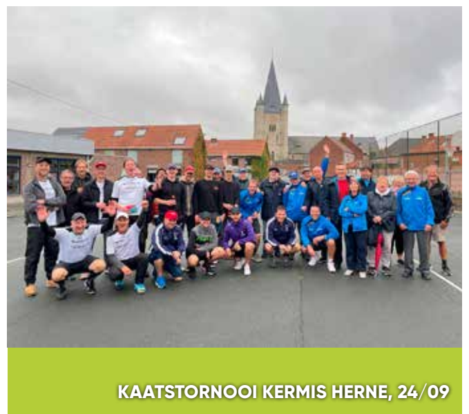
KAATSTORNOOI KERMIS HERNE, 24/09