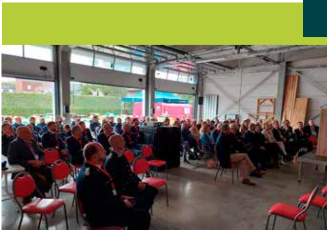
ACADEMISCHE ZITTING 10 JAAR BRANDWEER TOLLEMBEEK, 18/09