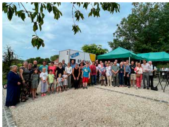
BUURTFEEST OMGEVING WEVERSTRAAT, 20/08