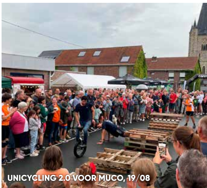
UNICYCLING 2.0 VOOR MUCO, 19/08