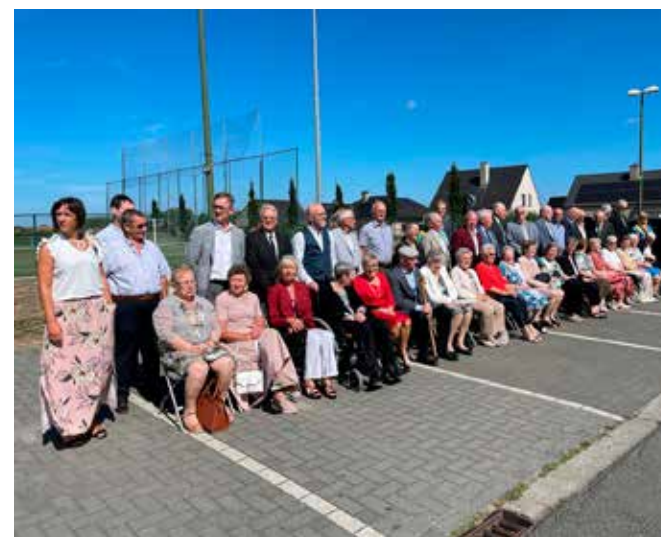
VIERING JUBILARISSEN, 28/08