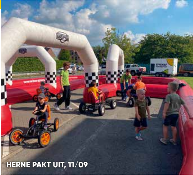
HERNE PAKT UIT, 11/09