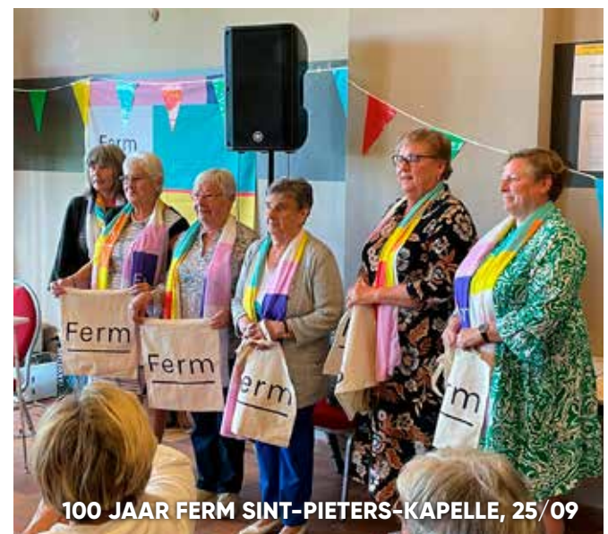
100 JAAR FERM SINT-PIETERS-KAPELLE, 25/09