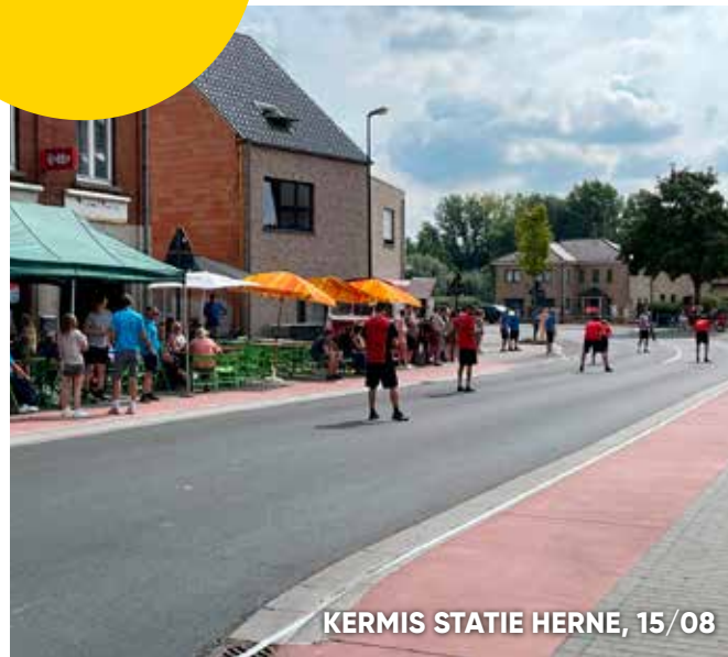
KERMIS STATIE HERNE, 15/08