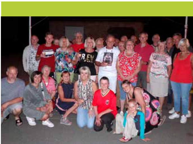
VERWELKOMING THUISKOMST GROOTOUDERS REMCO EVENEPOEL NA EINDWINST VUELTA, 12/09