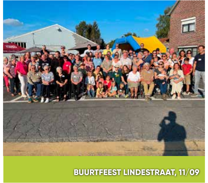
BUURTFEEST LINDESTRAAT, 11/09