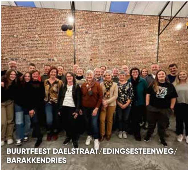
BUURTFEEST DAELSTRAAT/EDINGSESTEENWEG/ BARAKKENDRIES