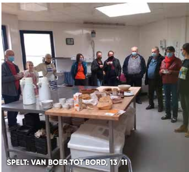
SPELT: VAN BOER TOT BORD, 13/11