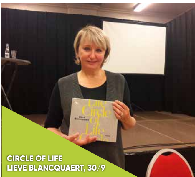
CIRCLE OF LIFE LIEVE BLANCQUAERT, 30/9