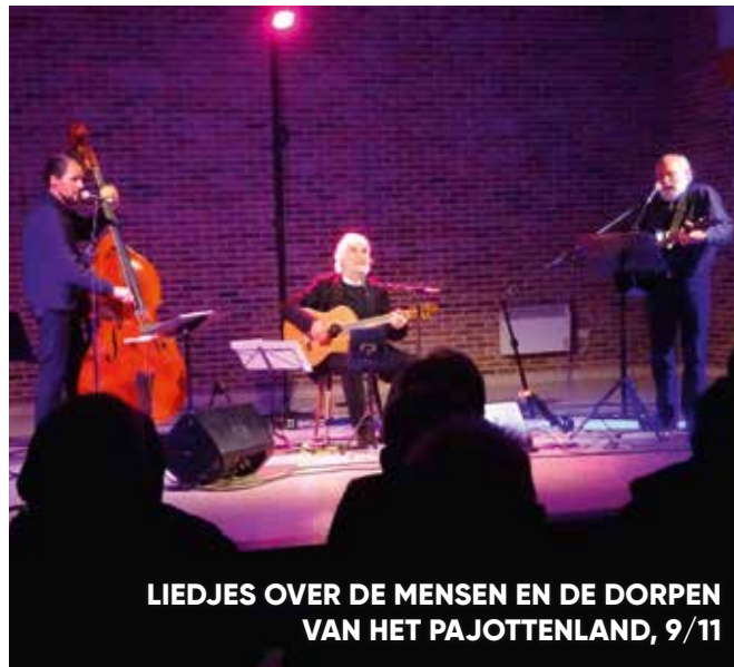
LIEDJES OVER DE MENSEN EN DE DORPEN VAN HET PAJOTTENLAND, 9/11