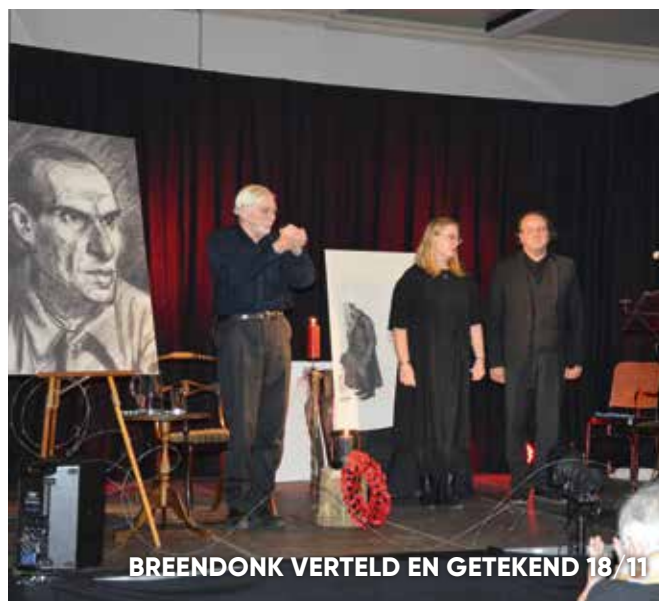
BREENDONK VERTELD EN GETEKEND 18/11