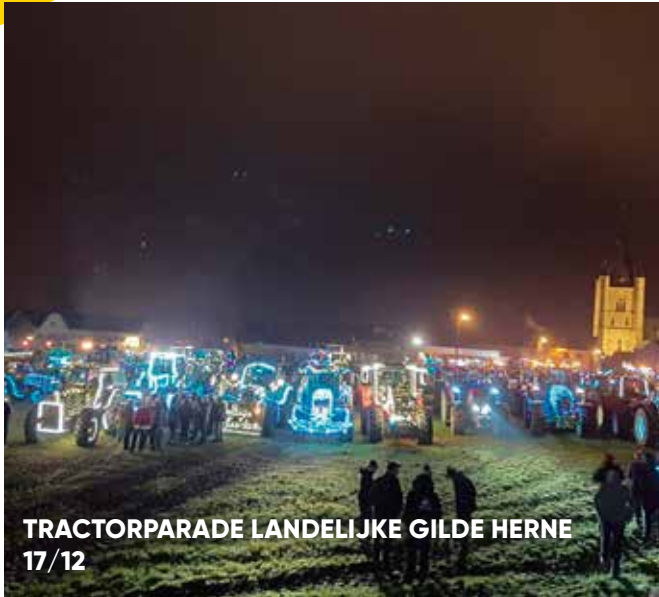
TRACTORPARADE LANDELIJKE GILDE HERNE 17/12