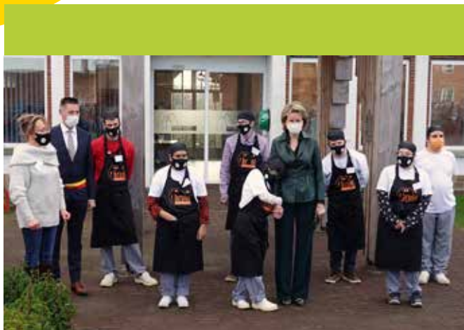
KONINGIN MATHILDE BEZOECT T'BRUUT, HET BAKKERSATELIER VAN MEEGAAN, 11/1