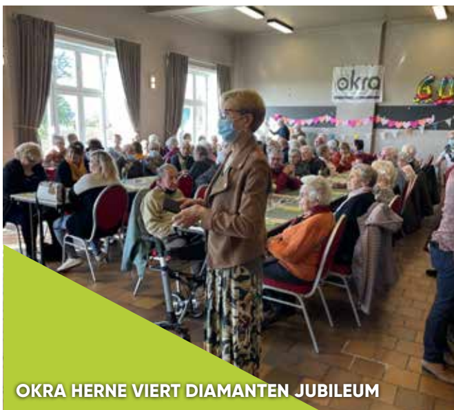
OKRA HERNE VIERT DIAMANTEN JUBILEUM