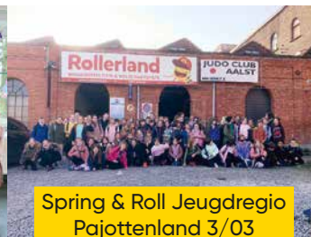
Spring & Roll Jeugdregio Pajottenland 3/03