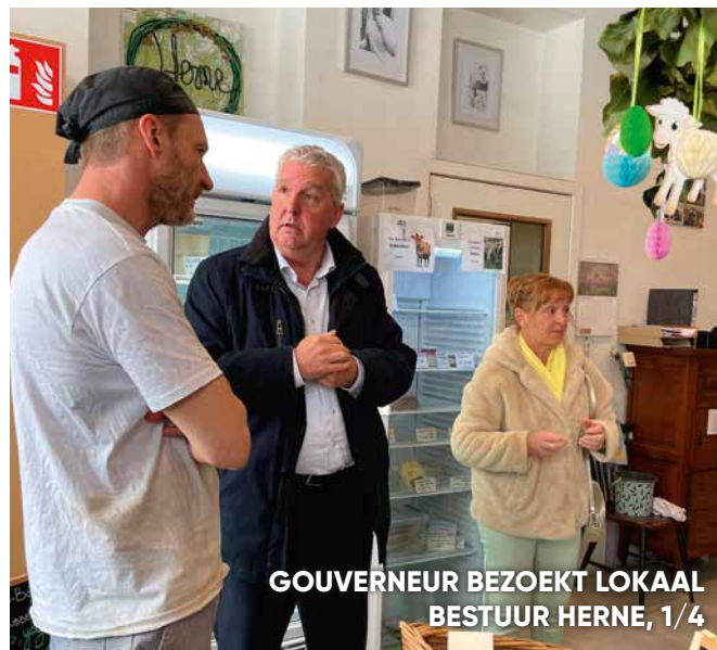
GOVERNEUR BEZOECT LOKAAL BESTUUR HERNE, 1/4