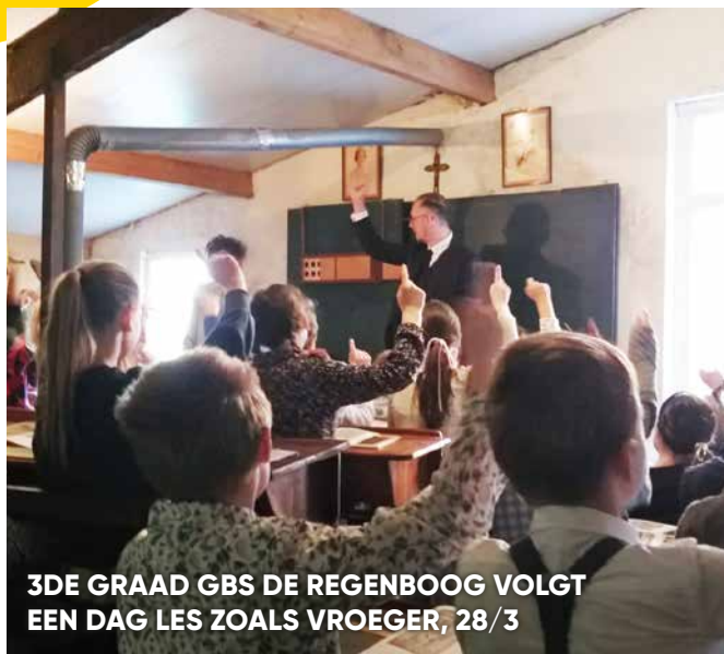
3DE GRAAD GBS DE REGENBOOG VOLGT EEN DAG LES ZOALS VROEGER, 28/3