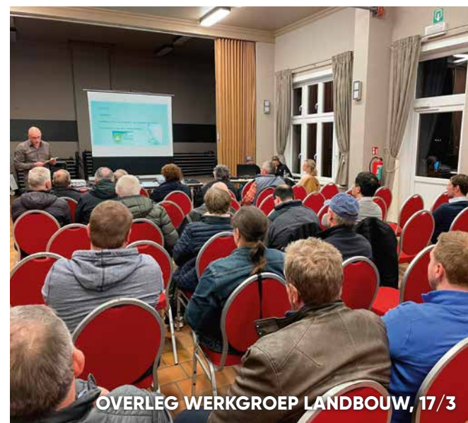
OVERLEG WERKGROEP LANDBOUW, 17/3