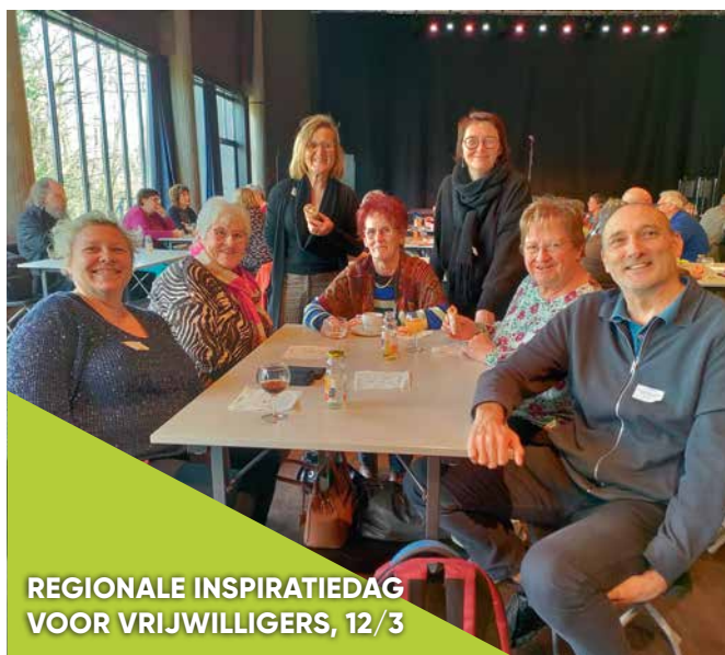
REGIONALE INSPIRATIEDAG VOOR VRIJWILLIGERS, 12/3