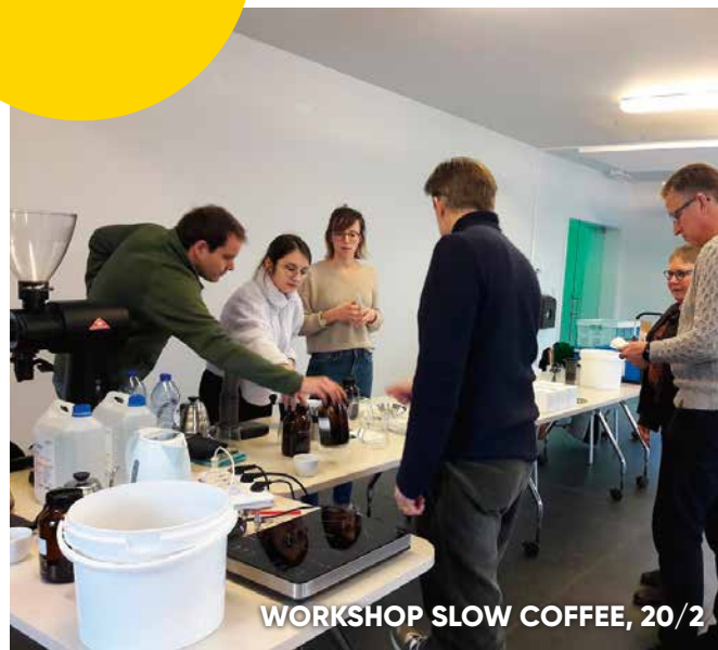
WORKSHOP SLOW COFFEE, 20/2