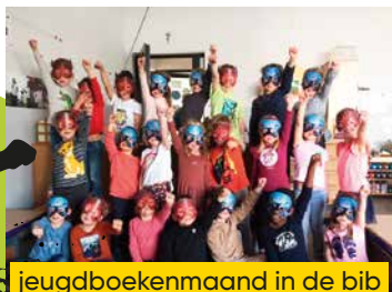
jeugdboekenmaand in de bib

Schrijf je dan in via www.jeugdregiopajottenland.be/inschrijven .