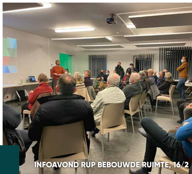
INFOAVOND RUP BEBOUWDE RUIMTE, 16/2