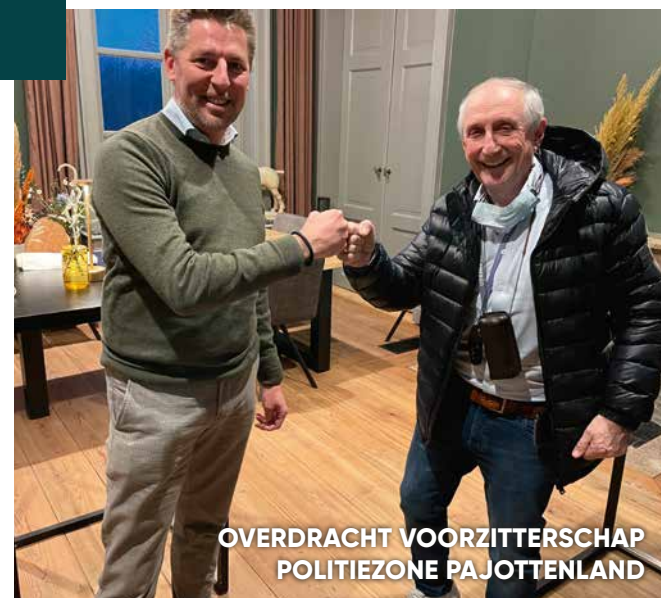
OVERDRACHT VOORZITTERSCHAP POLITIEZONE PAJOTTENLAND