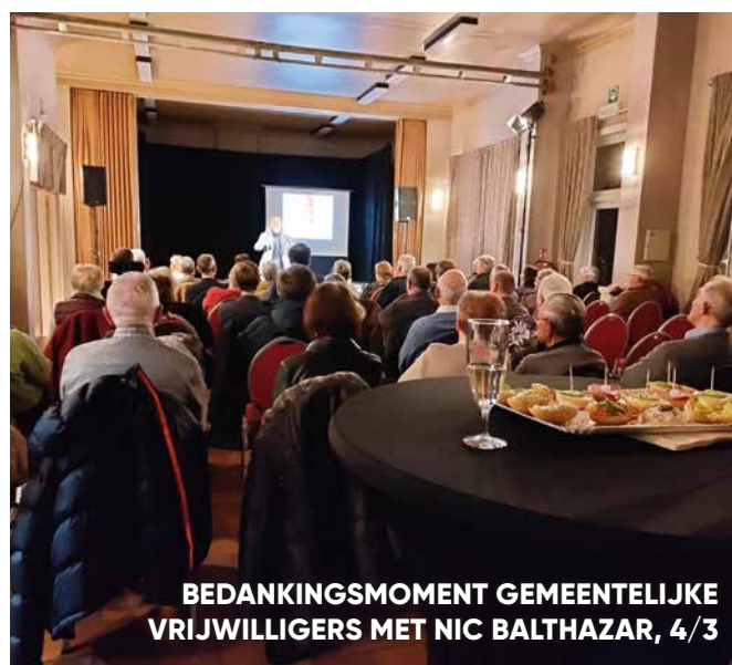
BEDANKINGSMOMENT GEMEENTELIJKE VRIJWILLIGERS MET NIC BALTHAZAR, 4/3