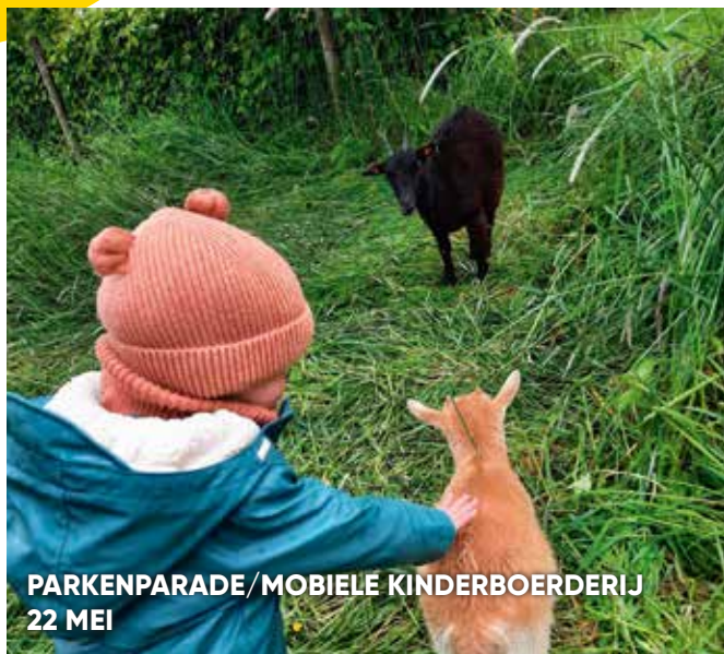
PARKENPARADE/MOBIELE KINDERBOERDERIJ 22 MEI