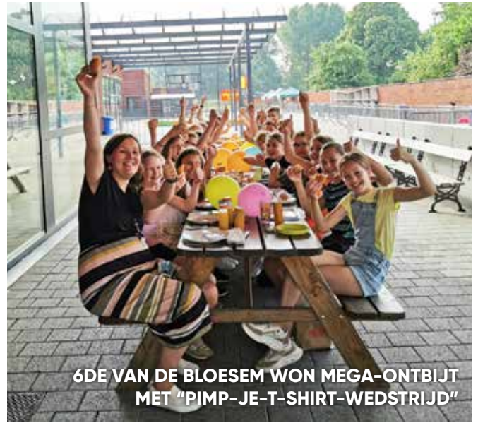
6DE VAN DE BLOEM WON MEGA-ONTBIJT MET "PIMP-JE-T-SHIRT-WEDSTRIJD"