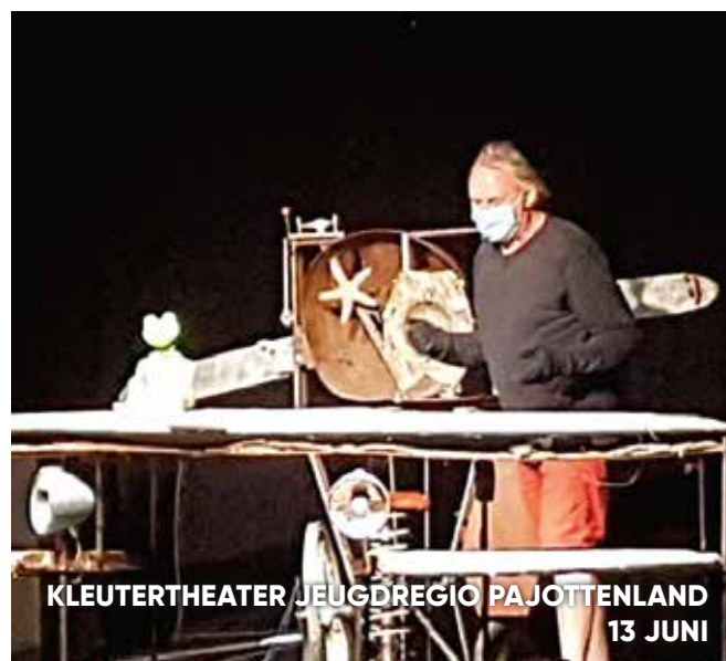
KLEUTERTHEATER JEUGDREGIO PAJOTTENLAND 13 JUNI