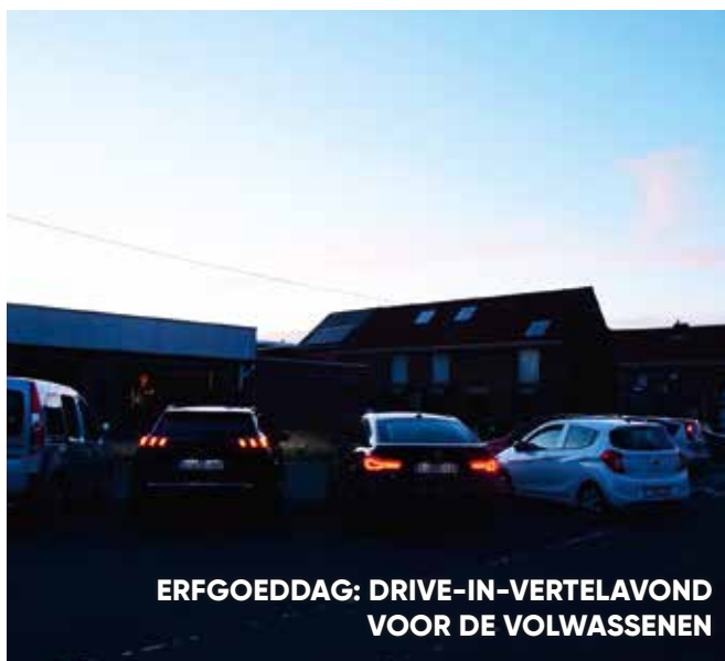
ERFGOEDDAG: DRIVE-IN-VERTELAVOND VOOR DE VOLWASSENEN