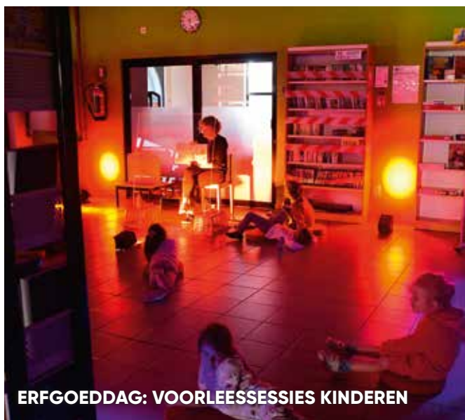
ERFGOEDDAG: VOORLEESSESSIES KINDEREN