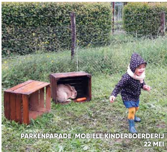
PARKENPARADE/MOBIELE KINDERBOERDERIJ 22 MEI