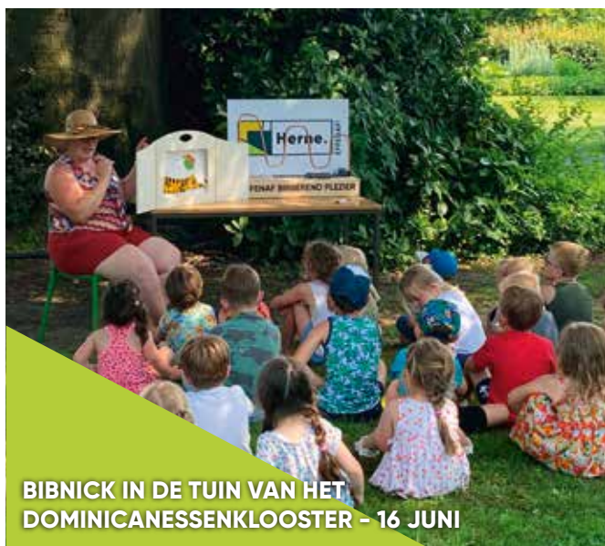
BIBNICK IN DE TUIN VAN HET DOMINICANESSENKLOOSTER - 16 JUNI