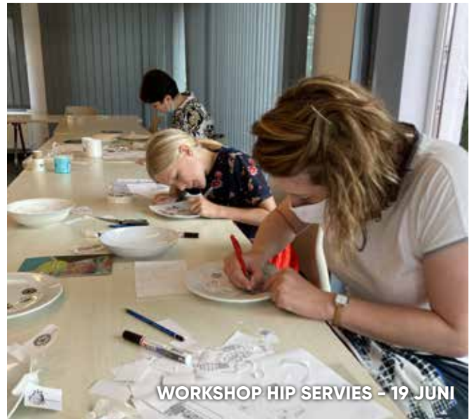
WORKSHOP HIP SERVIES - 19 JUNI