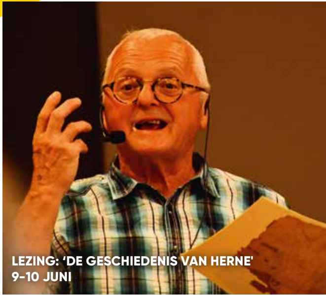
LEZING: 'DE GESCHIEDENIS VAN HERNE' 9-10 JUNI