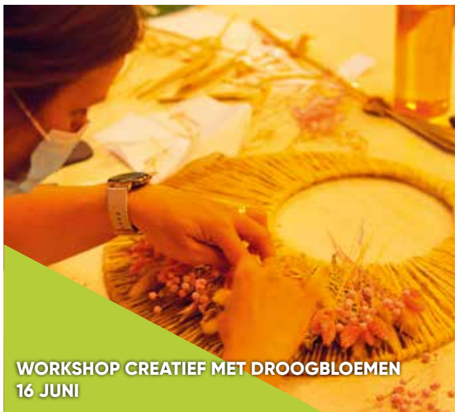
WORKSHOP CREATIEF MET DROOGBLOEMEN 16 JUNI