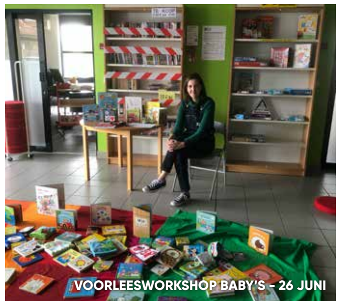
VOORLEESWORKSHOP BABY'S - 26 JUNI